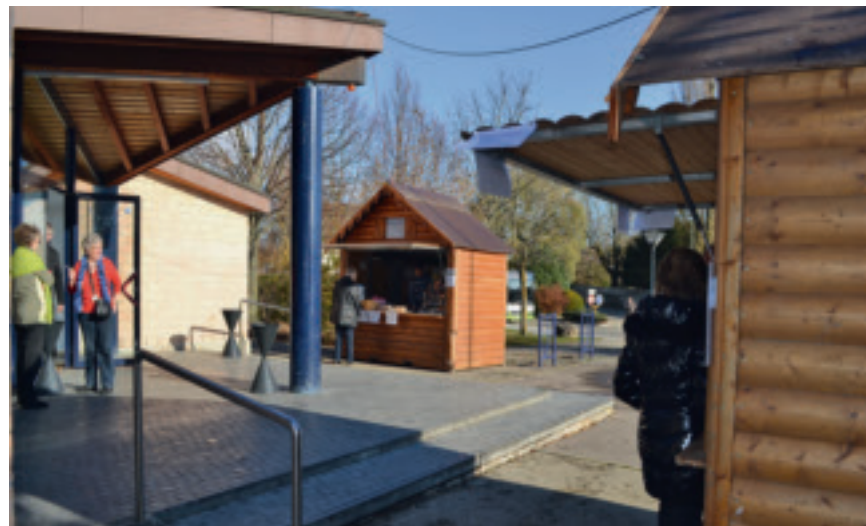
55 boutiques achalandées par 65 artisanes et artisans seront présentes lors du 24 e Comptoir d'artisanat.

Enfin, deux chalets en bois donneront une ambiance de fête devant l'entrée, dont l'un avec vente de vin chaud et de